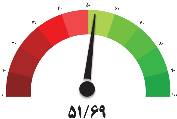
شاخص صنعت – دوره پنجاه و یکم

مرکز آمار و اطلاعات اقتصادی و پایش اصل ۴۴