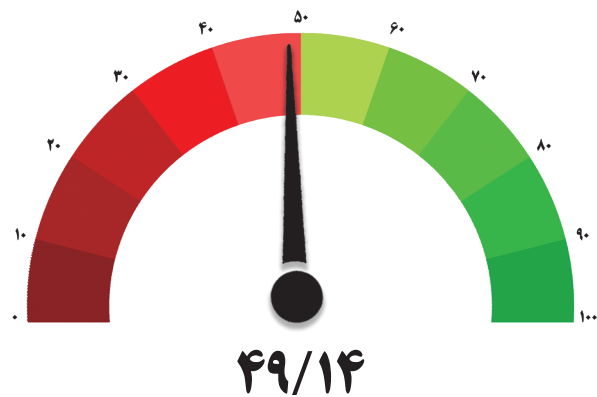
شاخص کل اقتصاد – دوره سی و نهم