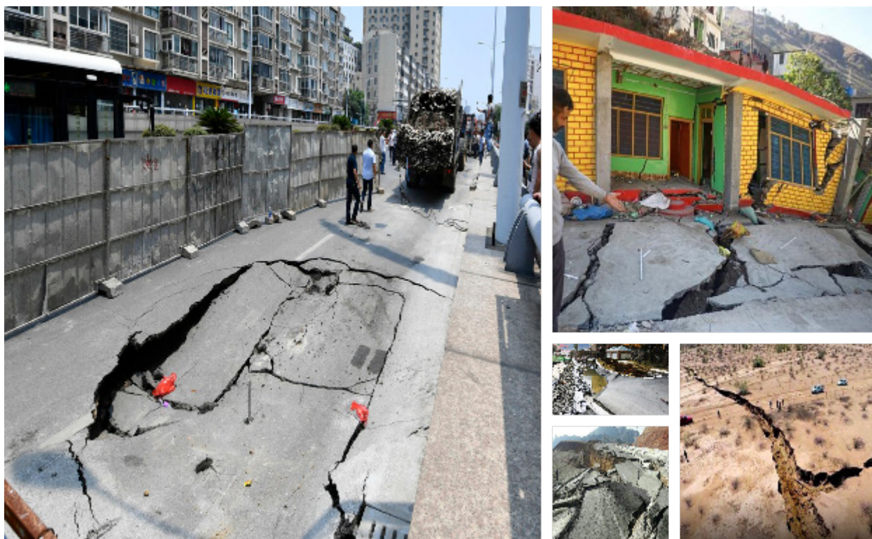
شکل ۳. خرابی‌های ناشی از پدیده فرونشست