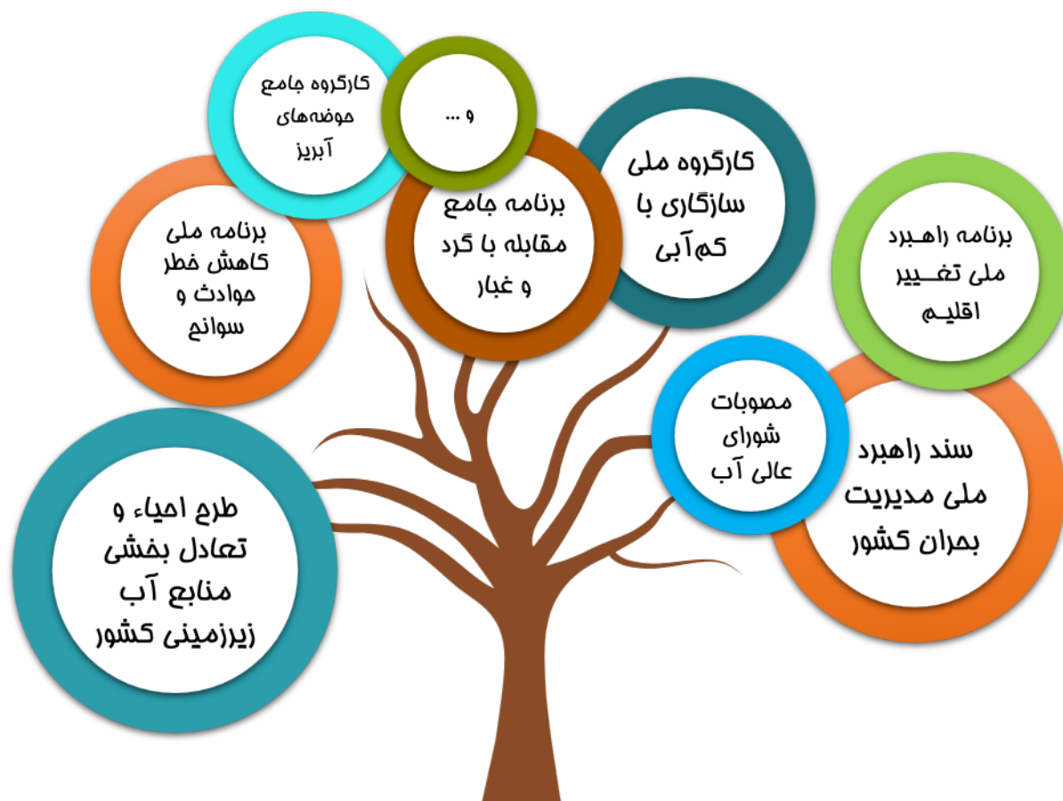
شکل ۱.۱. اهم اسناد و برنامه های ملی مرتبط با حوزه فرونشست